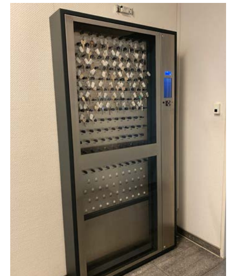
..und neue Schlüsselverwaltungssystem