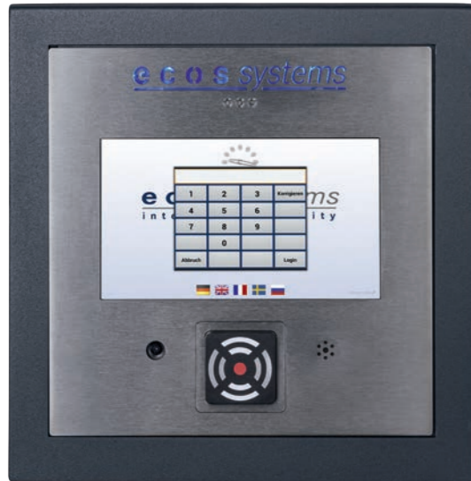
7" ecos Terminal, als Zutritts- und Gegensprechanlage mit RFID- oder Fingerprint-Leser